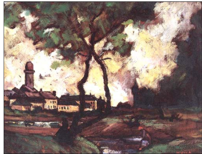
Malul Săsarului 2

Se stinge din viață la 4 iulie 1970 la Baia Mare.