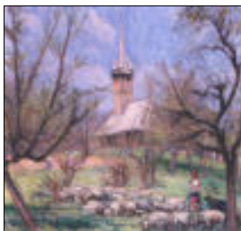
Biserica de lemn de pe Dealul Florilor