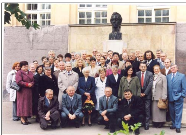
Cu dascăli și absolvenți ai Liceului „Mihai Eminescu” Satu Mare, în 2007, la întâlnirea de 40 de ani