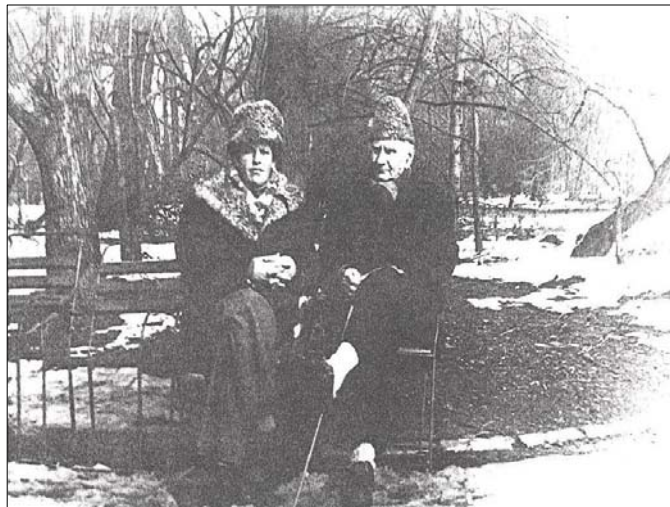
Cu Geo Bogza în Cișmigiu