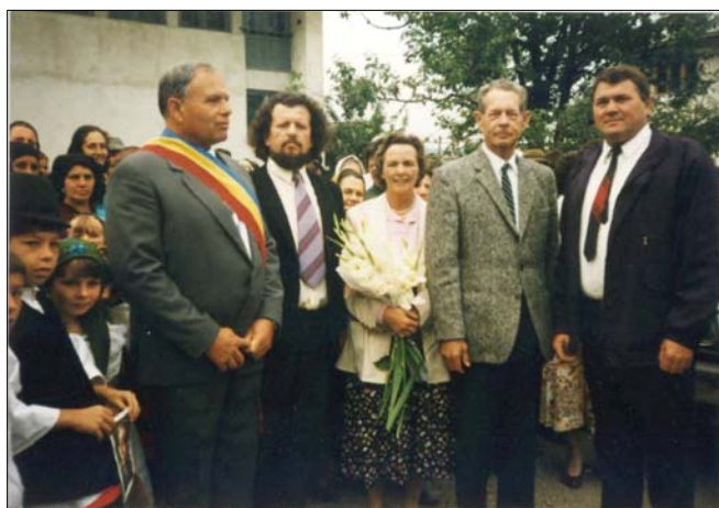
M. S. Regele Mihai I și Regina Ana în Petrova Maramureșului