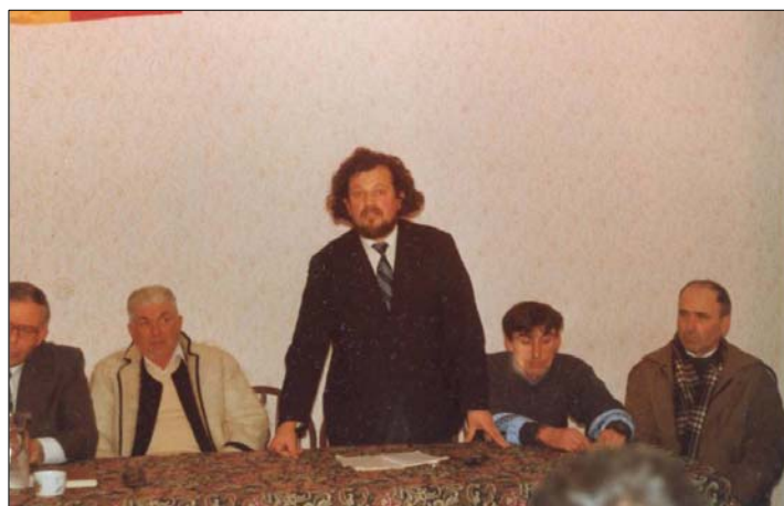
Vorbind în calitate de consilier în Consiliul Local Petrova