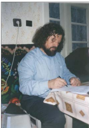
Lăsând „Umbre pe pânza vremii”