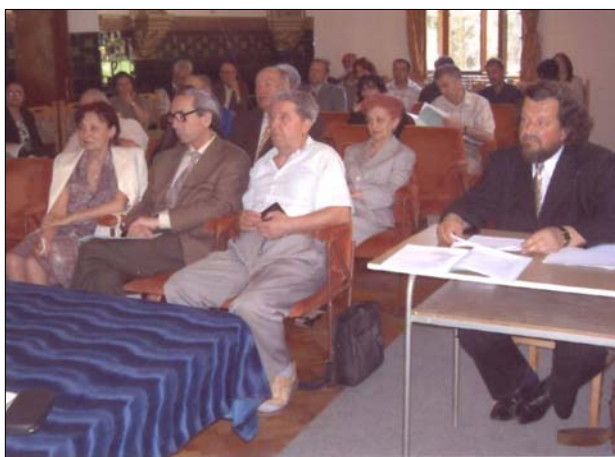
La susținerea tezei de doctorat – Cluj- Napoca, 2005