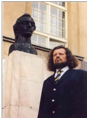
Vorbind la festivitatea de absolvire a Liceului „Mihai Eminescu” Satu Mare la 20 mai 1967 – „La aniversară” după patru decenii de la absolvirea Liceului „Mihai Eminescu” Satu Mare.