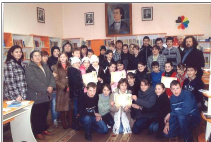
„Manifestările Eminescu 2009” din Petrova Maramureșului