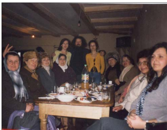
„Dineu de lucru” la Manifestările Eminescu devenite tradiție în Petrova Maramureșului în fiecare 15 ianuarie și 15 iunie